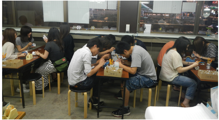
宇田津のガラス館で作成中。 すてきなコップが出来上がりました。