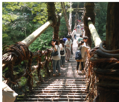
かづら橋渡り中。 慎重に。