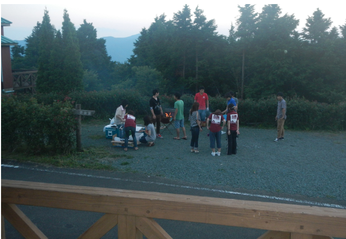
コテージ前でBBQ準備。 夜空がきれいでした。 深夜(朝方?)まで、盛り上がっていました。