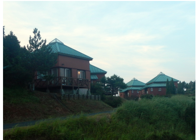
大豊町のコテージ。 朝夕は涼しく快適でした。