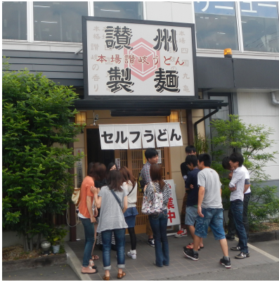
丸亀でうどんを食べました。 安くておいしかったです。