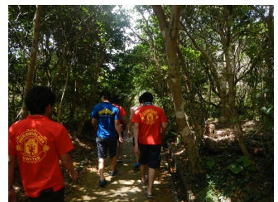
足摺岬への道中です