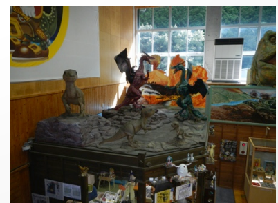
なつかしいもの、興味 を引くものあり