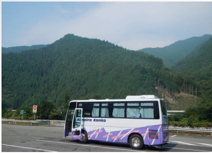
貸切りバス 高知の高速で 休息 朝6:45発 はや!