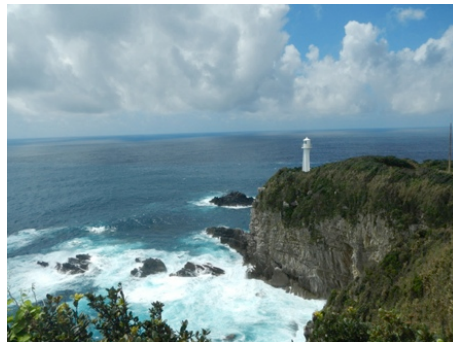
足摺岬は快晴でした。 ダイナミックな風景です