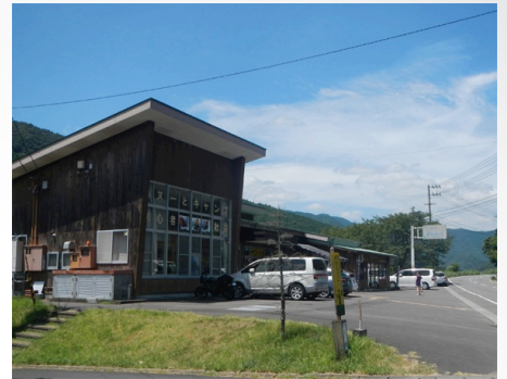
四万十川 カヌーに到着 暑い日でした