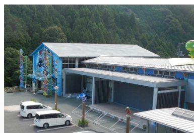
山の中のホビー館