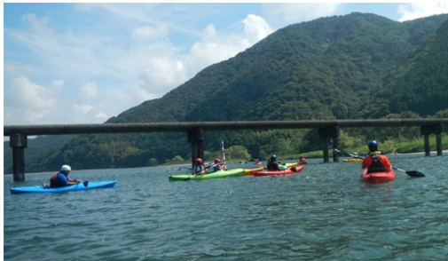
カヌーで遊び中 楽しい 約3時間 大自然を満喫