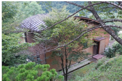
コテージに到着 良かった