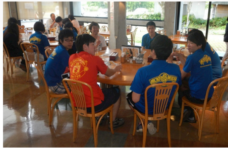
窪川で早いランチ カレーが人気でした