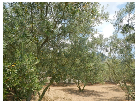
オリーブが、たくさんありました。