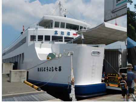
フェリーで小豆島到着