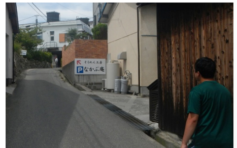
そうめんの体験をしました。