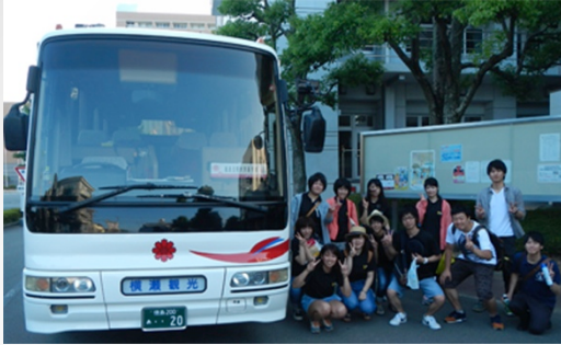
貸し切りバスで出発