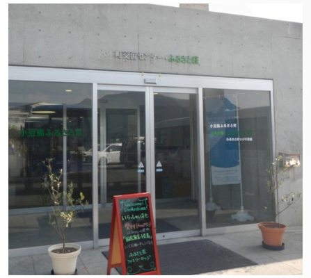
民宿で泊まりました