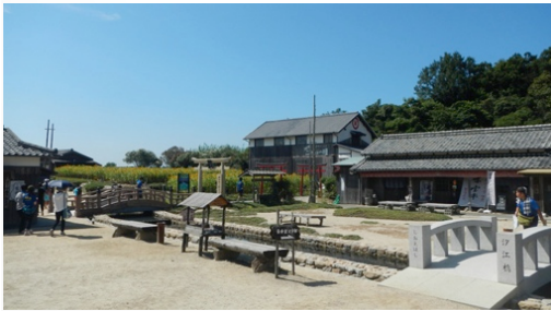
映画村に行きました。