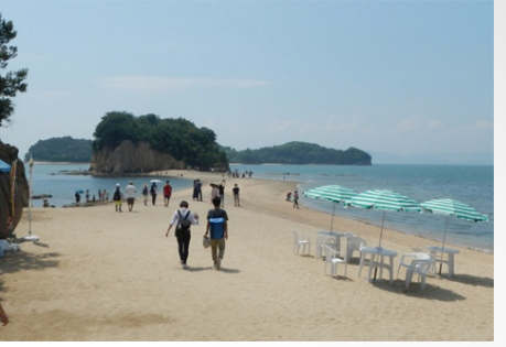
エンジェルロード