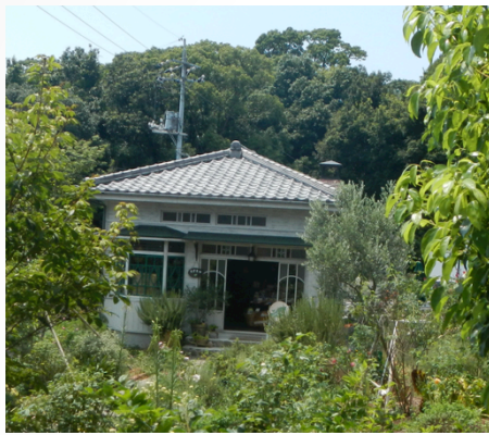
ジブリの家がありました