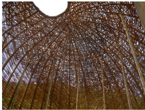
瀬戸内美術展の展示