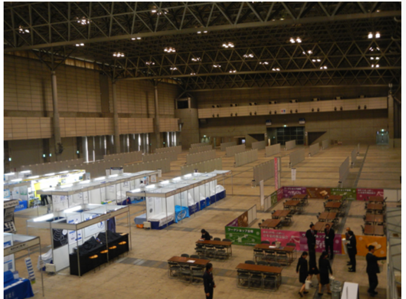
会場は、幕張メッセでした。