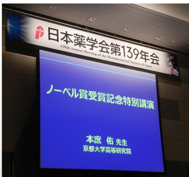
ノーベル賞記念講演を聞きました。